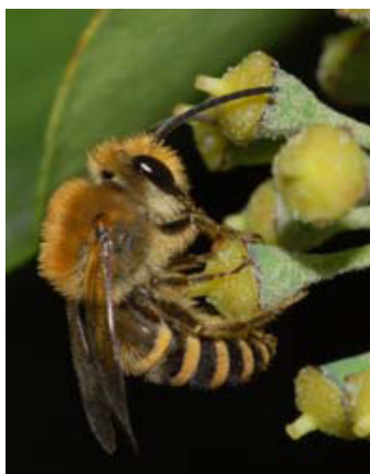
Mâle visitant des fleurs de lierre