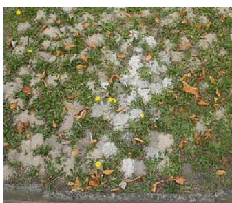
Nids de Colletes hederæ