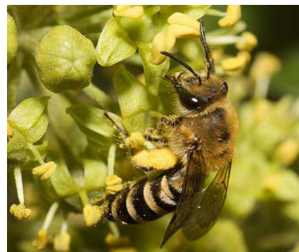
Femelle visitant des fleurs de lierre