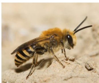
Mâle au repos